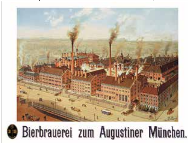
Augustiner Plakat 1885

2017 Nach einjähriger Umbauzeit eröffnet die Nürnberger Traditions-gaststätte Augustiner zur Schranke am Tiergärtnerort. Das Gebäude ist vermutlich 1545 erbaut worden. Seit dem 16. Jahrhundert ist hier eine Gaststätte „Zur Schranke“ nachgewiesen.