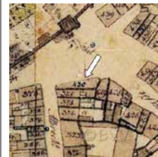
Lageplan 16. Jhd.

Kurzzeitig hieß die Gaststätte „Zum goldenen Rösslein“, ein Stich von J.A. Delsenbach aus dem Jahr 1714 belegt dies. Ab 1900 war dann die „Schranke“