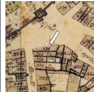
Site plan 16th century.

For a short time, the restaurant was called „Zum goldenen Röß-lein“, an engraving by J.A. Del-senbach from 1714 proves this. From 1900 onwards, the „Schran-ke“ was one of the best-known and most popular bars in the city. It wasn't the devastating bomb attack of January 2, 1945, but the